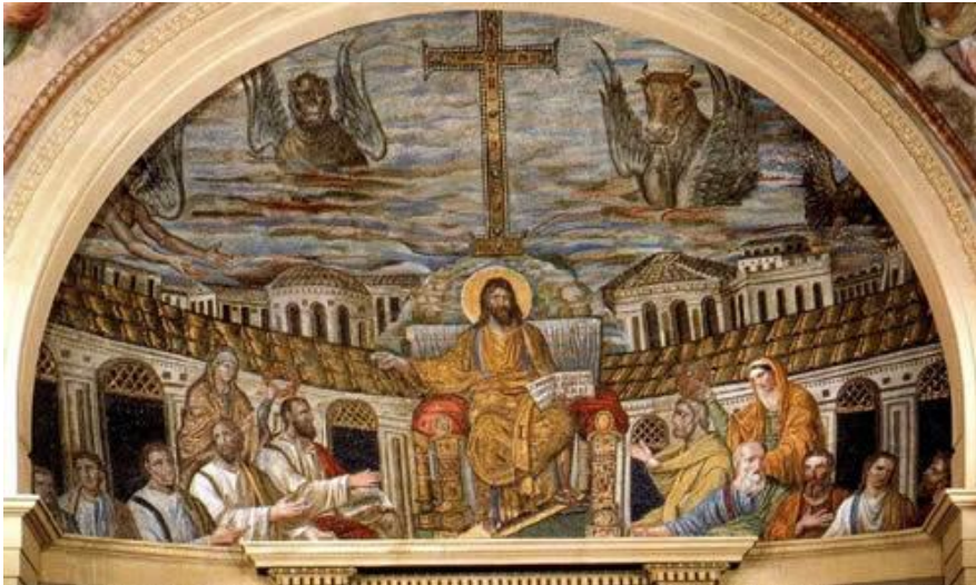
Mosaico di Cristo in trono nella Basilica di Santa Pudenziana

I soffitti e le pareti delle basiliche paleocristiane spesso erano decorati con dei mosaici, come ad esempio quello che rappresenta Cristo in trono e si trova nella Basilica di Santa Pudenziana .