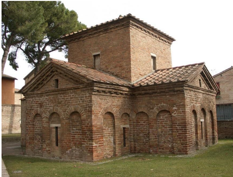
Mausoleo di Galla Placidia

Questo edificio fu costruito per Galla Placidia, che era un'imperatrice. All'esterno è ricoperto di mattoni, ma all'interno è decorato con mosaici colorati.