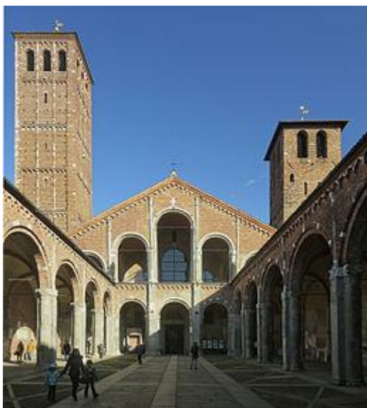
Cattedrale di Sant'Ambrogio a Milano

Nel periodo romanico la chiesa è l'edificio più importante e più alto della città. Il suo campanile si vede da lontano. È costruita in pietra o mattoni e davanti ad essa c'è una piazza dove i cittadini si incontrano per le feste e il mercato.