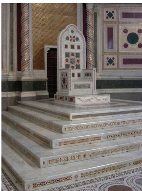
Cattedra del vescovo di Roma nella Basilica di San Giovanni in Laterano

Alcune chiese si chiamano cattedrali perché al loro interno c'è la cattedra , cioè il sedile del vescovo.