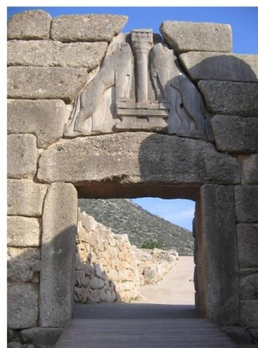
PORTA DEI LEONI