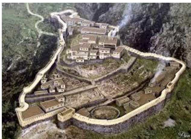
ROCCA DI MICENE

Anche la città di Micene sorgeva su una collina. La parte più alta si chiamava rocca ed era circondata da mura. Si poteva entrare nella rocca attraverso un ingresso chiamato Porta dei Leoni .